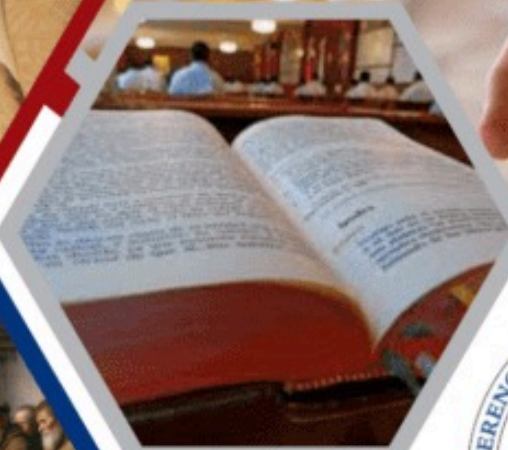
Liturgia de las Horas